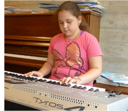
Ab 1. Primarklasse