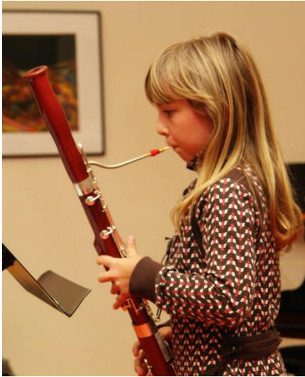
Ab 1. Primarklasse