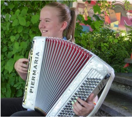
Ab 1. Primarklasse